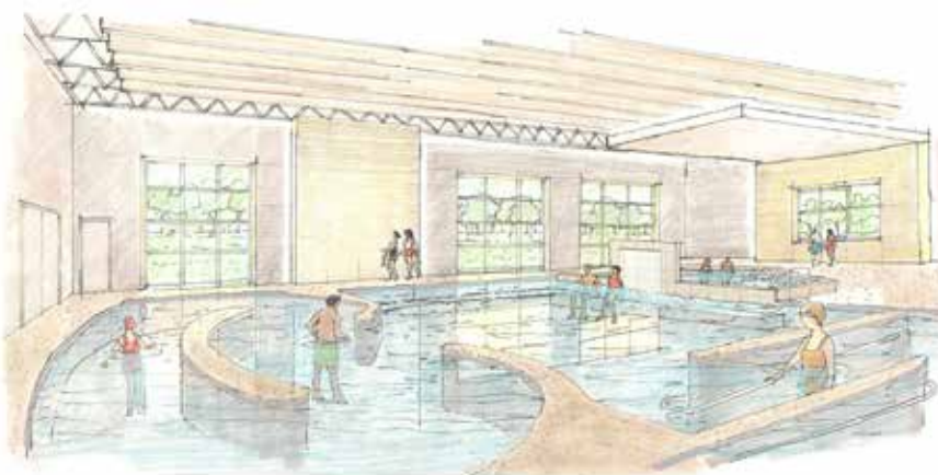
Se agregará una piscina terapéutica en Eagle Pointe (anteriormente llamado Centro Recreativo Commerce City)