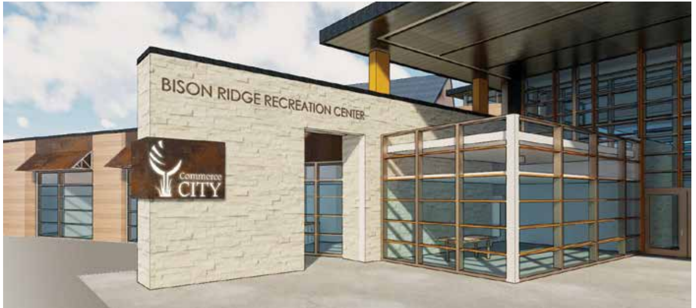
CENTRO RECREATIVO BISON RIDGE (Será inaugurado en la primavera del 2018) 13905 E. 112th Ave.