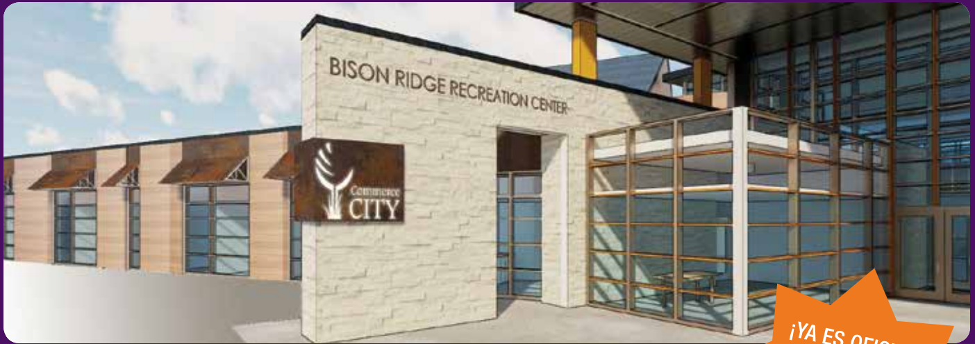
El Centro Recreativo Bison Ridge será inaugurado durante la primavera del 2018

¡YA ES OFICIAL! Los centros recreativos tienen nuevos nombres. Vea la página 2.