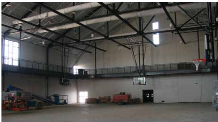
Pista para Caminar en Bison Ridge