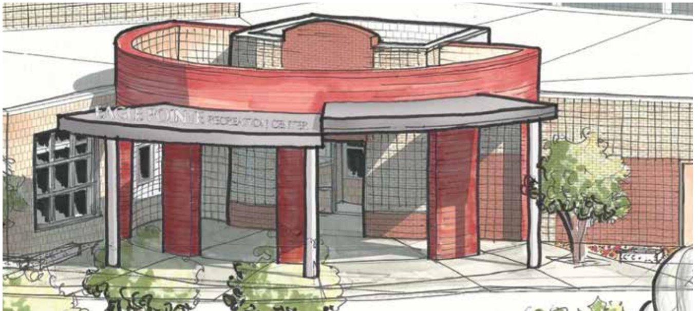
CENTRO RECREATIVO EAGLE POINTE, 6060 E. PARKWAY DR. (Anteriormente conocido como Centro Recreativo Commerce City)

Ya es oficial: ¡el nuevo centro recreativo de la ciudad y el centro recreativo existente tienen nuevos nombres! A principios de este año, la ciudad les pidió a los residentes que ayudaran a nombrar las nuevas instalaciones (la cual será inaugurada la próxima primavera) y ayudar a cambiar el nombre del centro recreativo existente.