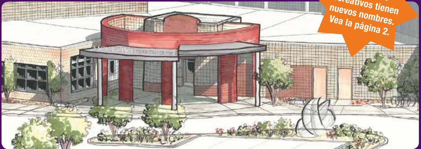
Las renovaciones comenzaran en el existente Centro Recreativo Eagle Pointe a principios del 2018

¡YA ES OFICIAL! Los centros recreativos tienen nuevos nombres. Vea la página 2.